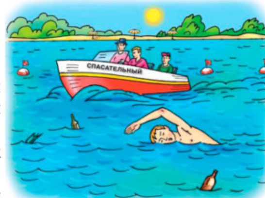
Не заплывайте за ограничительные знаки мест, отведённых для купания! Не подплывайте к большим судам, весельным лодкам, баржам.